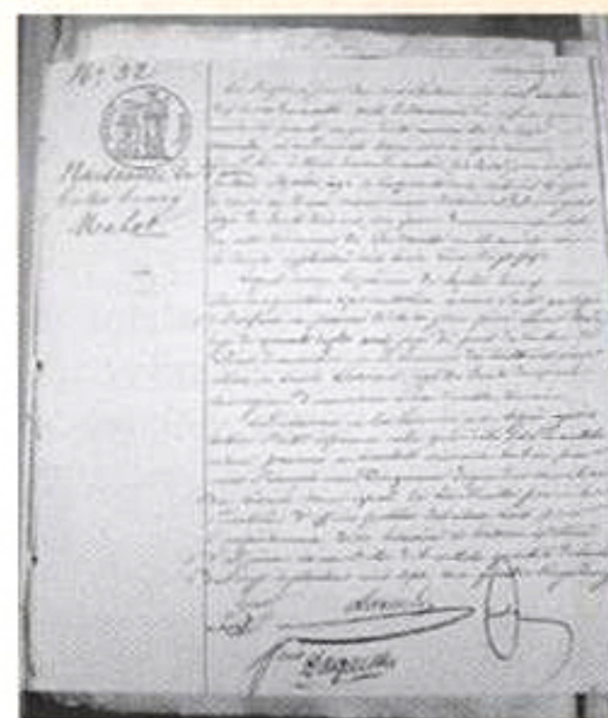
L'acte de naissance d'Hector Malot.

C'est dans cette mairie, faisant face au Grenier à sel, – Jean-Baptiste Malot y fut maire pendant 22 ans ! –, qu'a été rédigé l'acte de naissance du romancier, aujourd'hui consultable dans l'actuelle mairie.