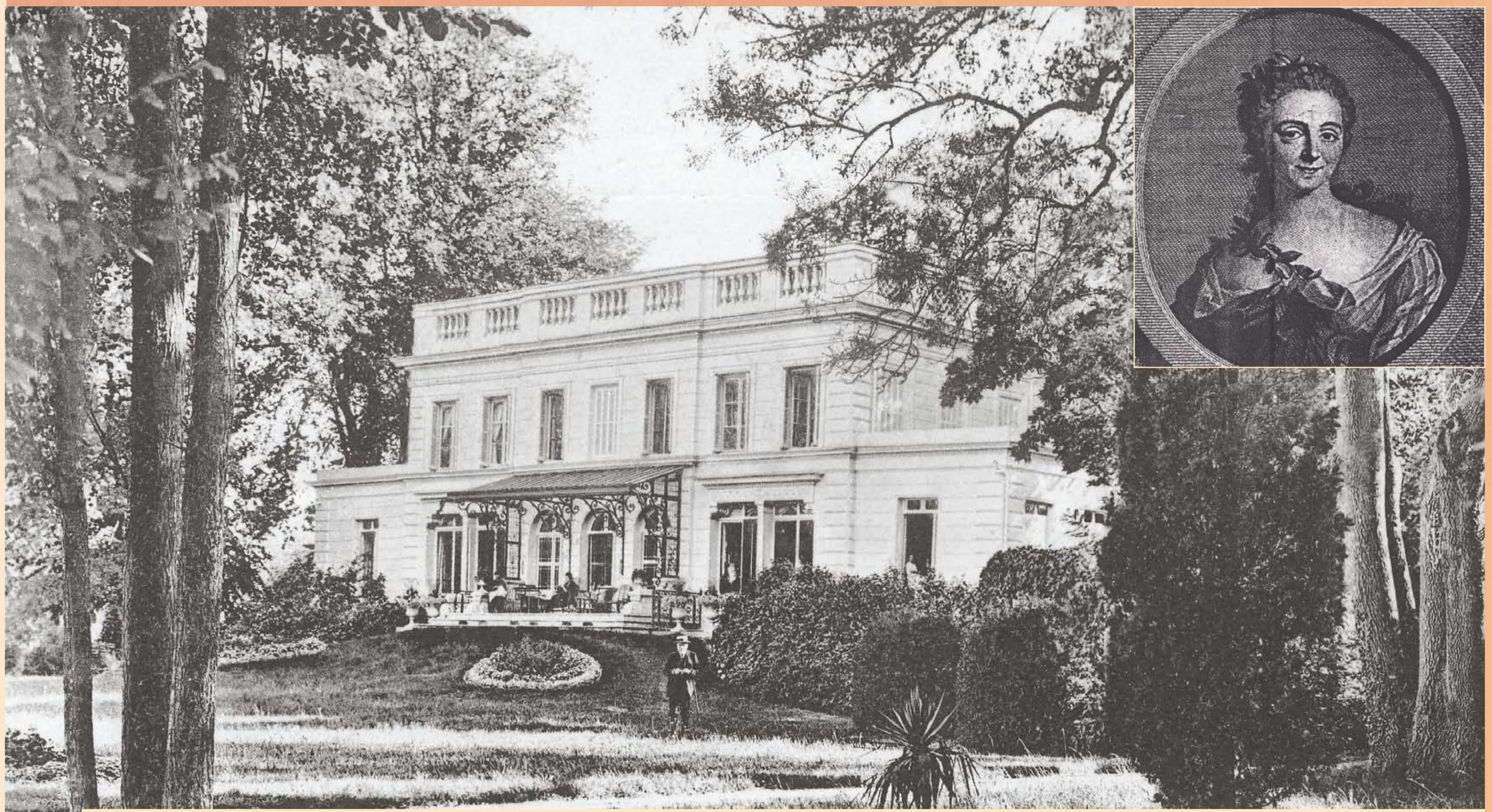
Marie du Bocage (1710-1802) a résidé dans cette demeure, où elle a reçu son ami Fontenelle. Elle y a rédigé La colombiade .

« Jusque-là toutes les distractions de la famille consistaient en promenades aux environs le dimanche, aux roches d'Orival, au chêne de la Vierge, en parties dans la forêt qui, quelquefois, en été, se prolongeaient par le château de Robert-le-Diable jusqu'à La Bouille, pour y manger des douillons et des matelotes. » ( Baccara , 1886).