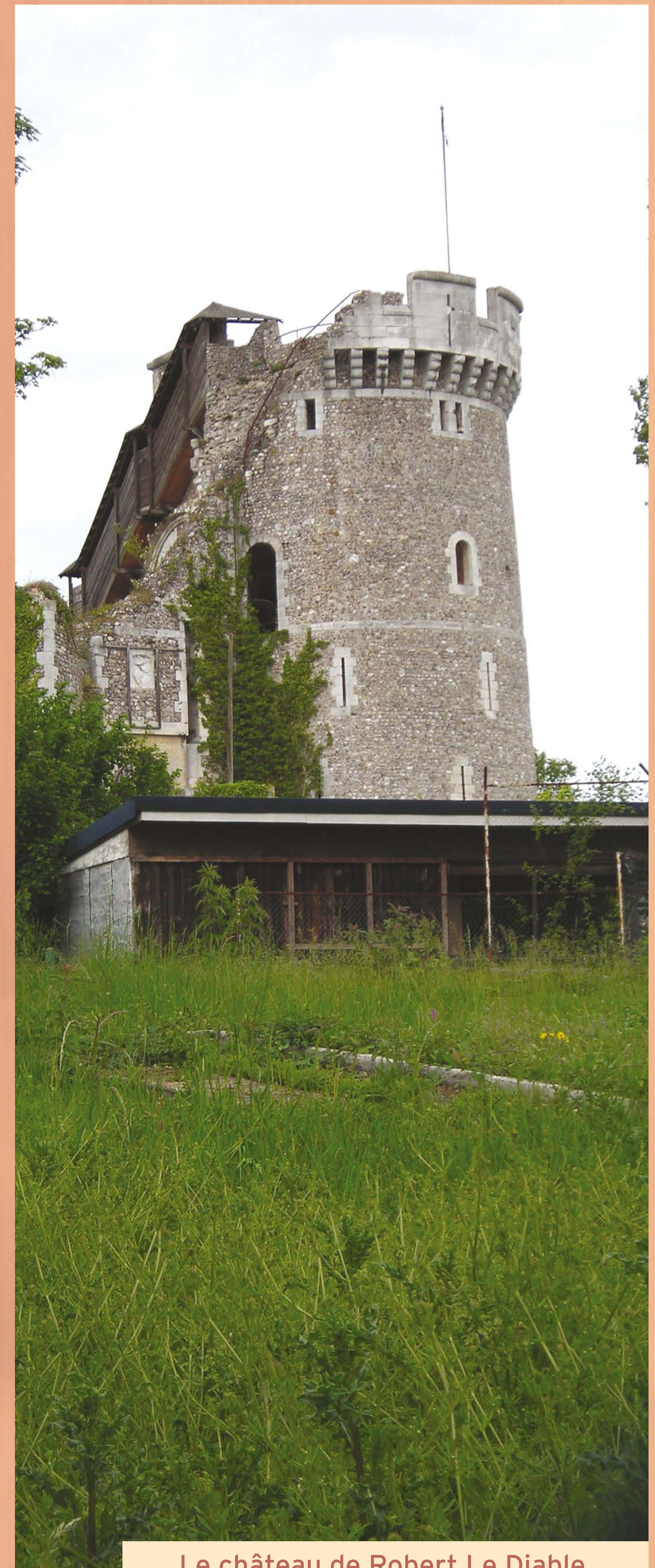
Le château de Robert Le Diable.